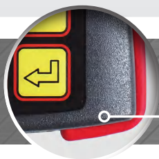
Ударопрочный эргономичный корпус